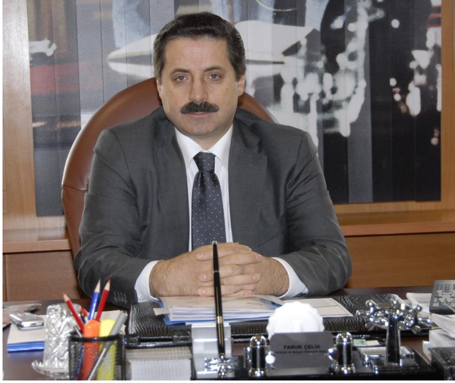
Faruk ÇELİK Çalışma ve Sosyal Güvenlik Bakanı