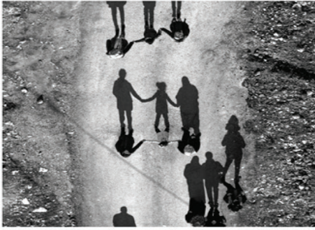
Fuat YETKİN - AİLECE ELELE

Temmuz 2019 dış ilişkiler e-bülteni sayı: 21