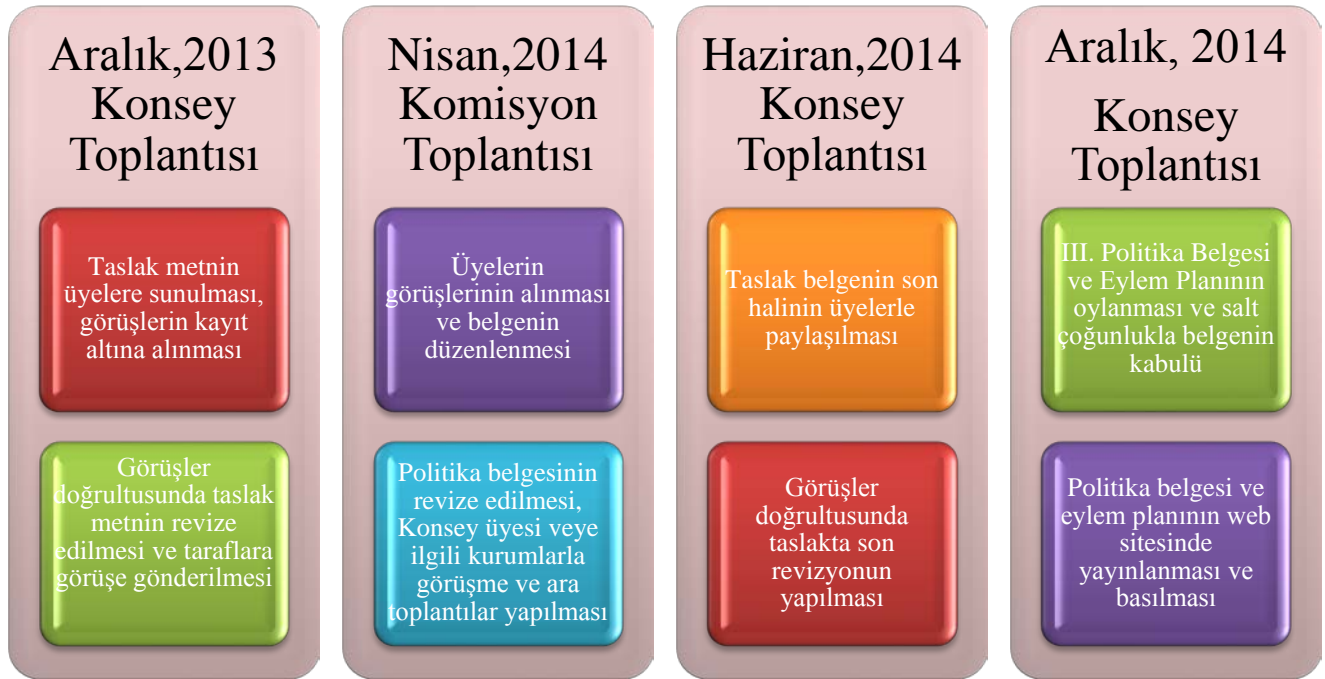
Şekil 2. 2014-2018 Dönemi Politika Belgesi ve Eylem Planı Hazırlık Aşamaları