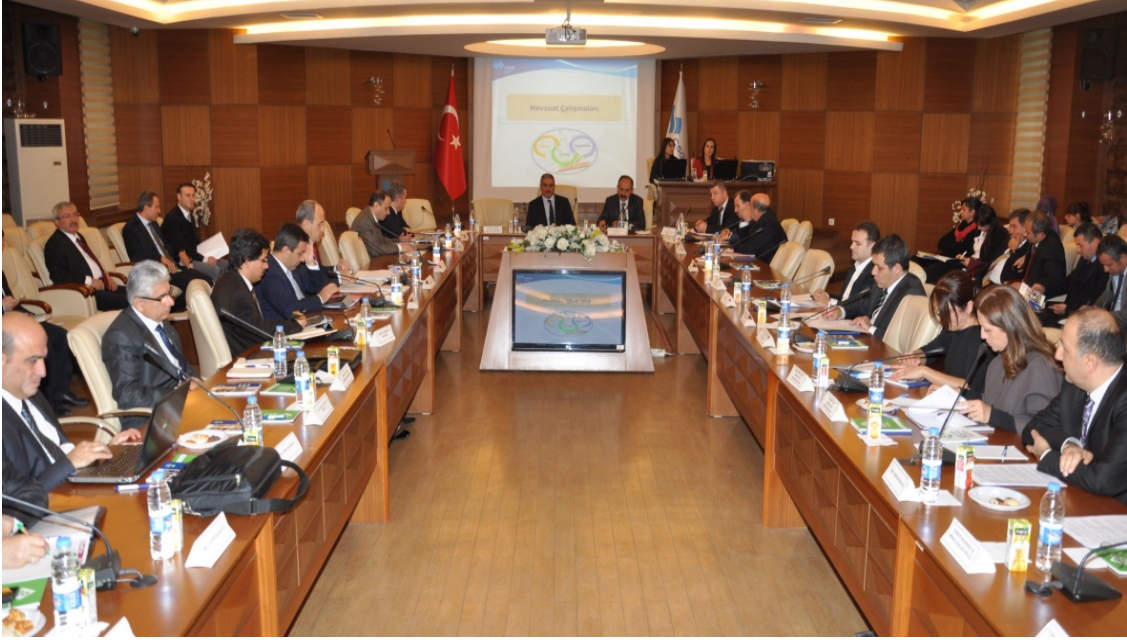
Resim 1. 21. Konsey Toplantısı